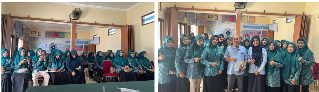
Gambar 3. Kegiatan Penyuluhan pada Kader

Kegiatan pengabdian masyarakat ini menargetkan peningkatan peran kader kesehatan di Posyandu Desa Manggung dalam deteksi dini suspect flat foot . Pelatihan difokuskan pada teknik-teknik pemeriksaan sederhana yang dapat dilakukan secara mandiri oleh kader tanpa peralatan medis khusus. Kegiatan pengabdian telah dilakukan dengan baik pada bulan Mei 2026 di kantor kelurahan Desa Manggung, Kecamatan Ngemplak, Kabupaten Boyolali. dihadiri istri kepala desa dan 40 ibu kader kesehatan dari perwakilan posyandu masing-masing.